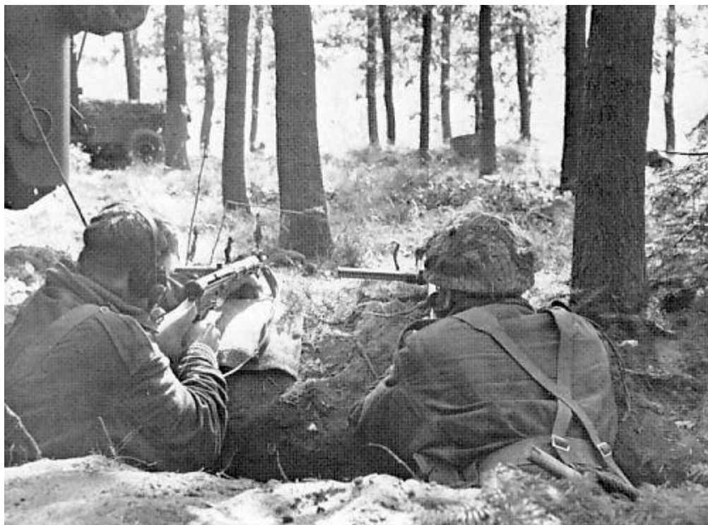
Afbeelding 1: Verdediging van de perimeter

Maar daar hebben we genoten van een uitstekende lunch en na de middagpauze zijn we weer verder gegaan richting de Rijn en Westerbouwing, die is overigens ook helemaal verwoest door de intense gevechten, hier heeft nog een Canadees getracht de Duitsers tegen te houden wat niet gelukt is en hij is daar ook gesneuveld. Dan had je daar ook nog de Hemelse berg in de buurt, dit was de laatste verdedigingslinie van de para's, deze is trouwens nooit serieus door de Duitsers aangevallen.